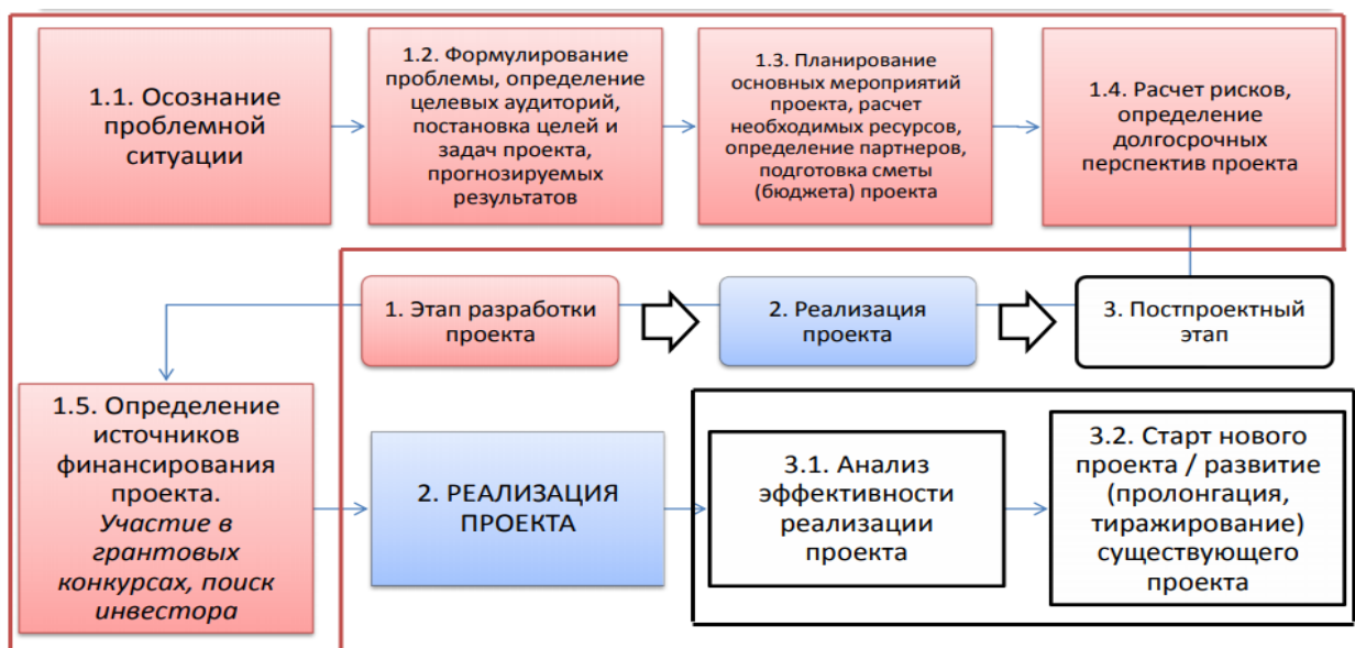
Рис. 1. Схема-алгоритм создания бизнес-модели в инновационной экономике